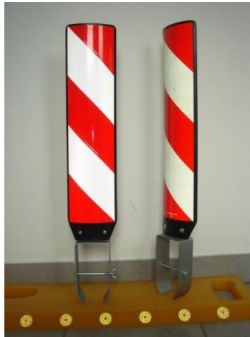
Simbolična slika pokončne smerne deske