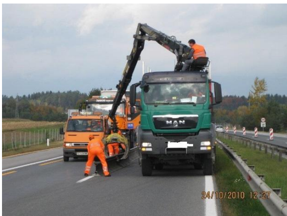
Pomoč delavcev naročnika pri postavitvičasne premične jeklene varnostne ograje na linijo zapore.

zahtevanem roku. Njegovo delo je prevoz, nalaganje in razlaganječasne premične jeklene varnostne ograje. Pri montažičasne premične jeklene varnostne ograje na linijo zapore je izvajalcu v pomoč skupina delavcev naročnika, ki načasne premične jeklene varnostne ograje sami montirajo pokončne smerne deskečasne premične jeklene varnostne ograje, predstavljene na spodnji simbolični sliki.